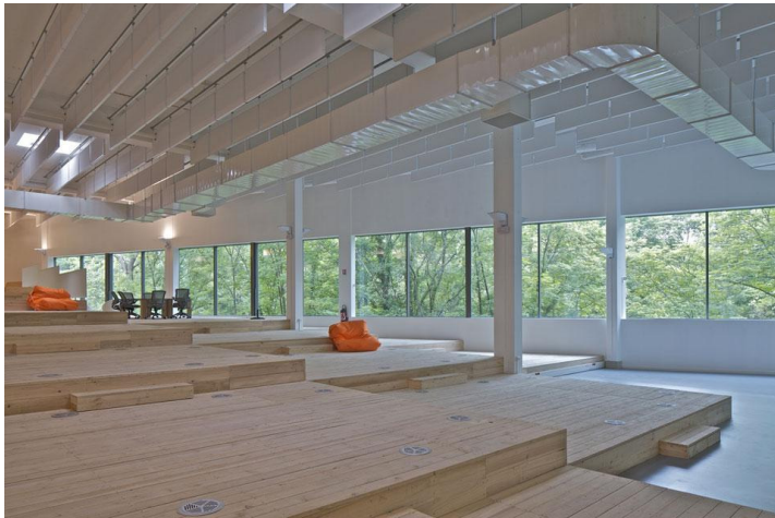
MVRDV, trasformazione dell'edificio dismesso dei laboratori della Telettech, Dijon, Francia

http://www.domusweb.it/it/news/mvrdv-call-center-telettech/