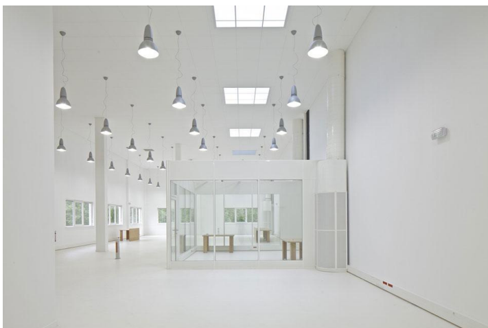
MVRDV, trasformazione dell'edificio dismesso dei laboratori della Teletch, Dijon, Francia