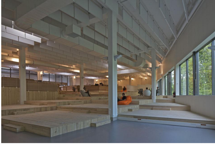
MVRDV, trasformazione dell'edificio dismesso dei laboratori della Teletch, Dijon, Francia