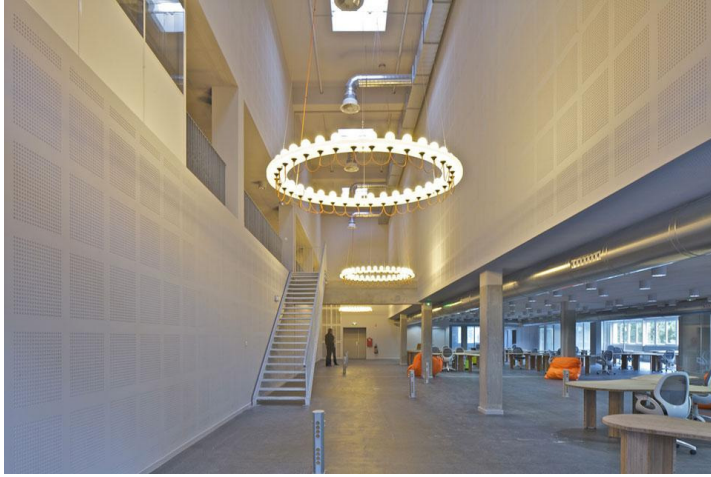
MVRDV, trasformazione dell'edificio dismesso dei laboratori della Telettech, Dijon, Francia