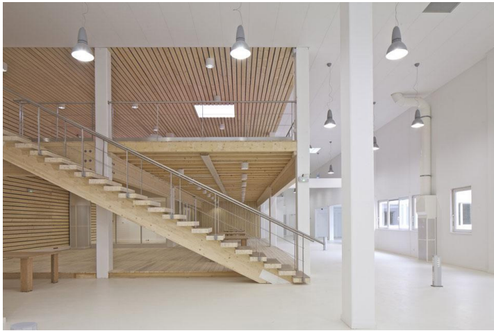
MVRDV, trasformazione dell'edificio dismesso dei laboratori della Teletch, Dijon, Francia